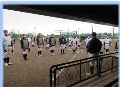
距離を取って活動しています。